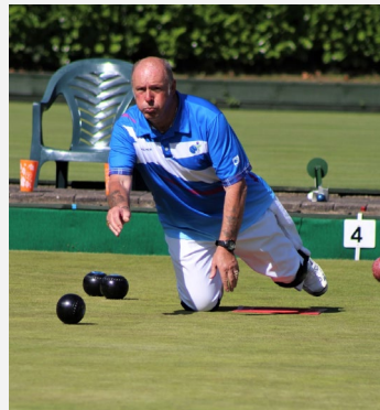
À genoux sur le tapis