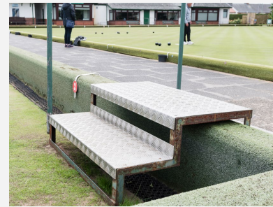
Marches au-dessus du fossé