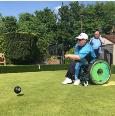
Fauteuils roulants modifiés/spécialisés