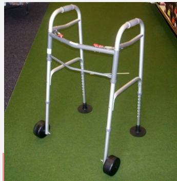
Cadre de marche spécial *