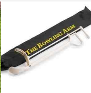
Aide au lancer / Ubi_Launcher®